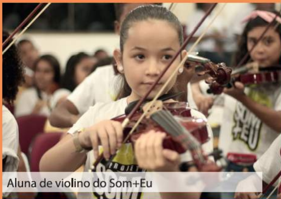
Aluna de violino do Som+Eu