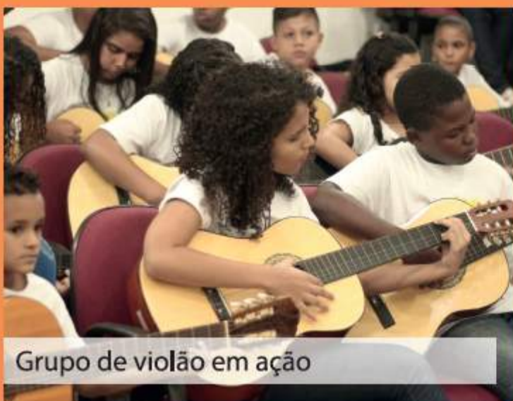
Grupo de violão em ação