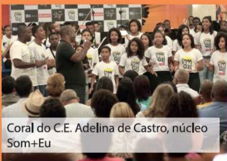
Coral do C.E. Adalina de Castro, núcleo Som+Eu