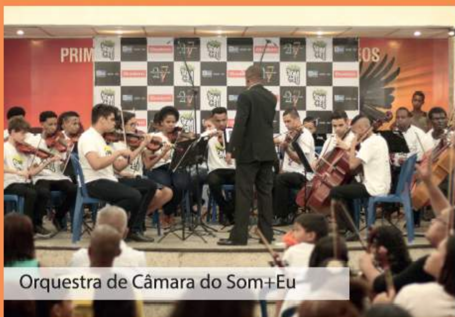
Orquestra de Câmara do Som+Eu