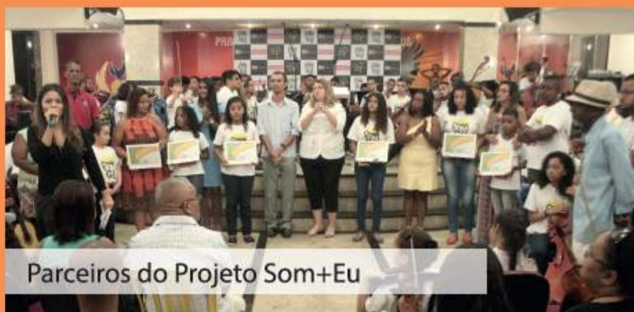
Parceiros do Projeto Som+Eu