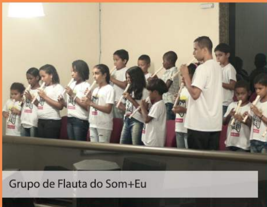
Grupo de Flauta do Som+Eu